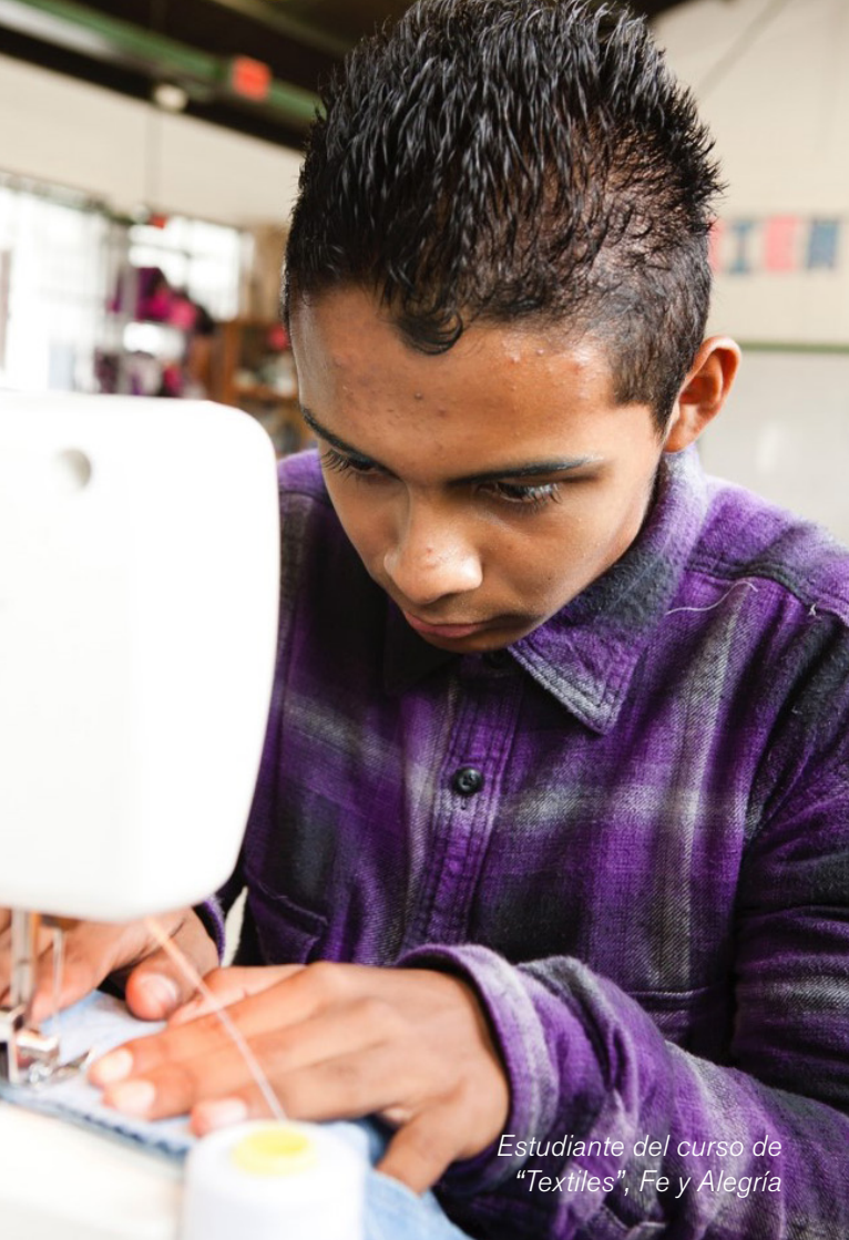
Estudiante del curso de "Textiles", Fe y Alegría