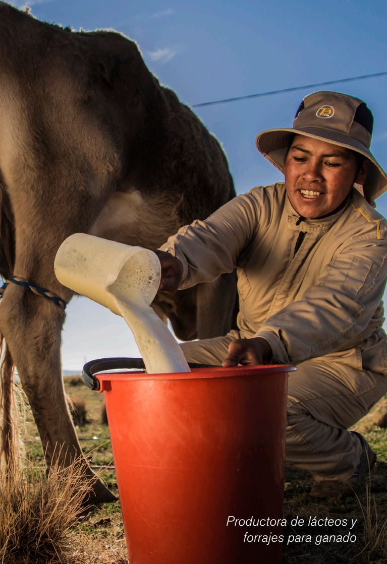
Productora de lácteos y forrajes para ganado