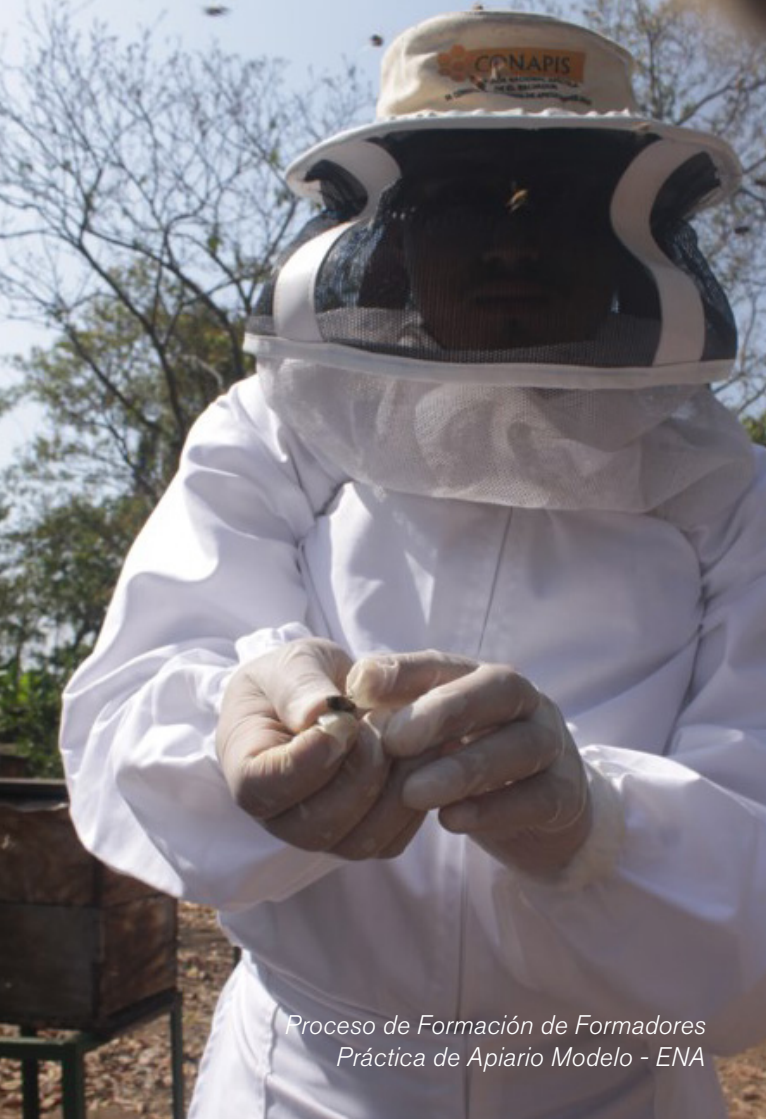
Proceso de Formación de Formadores Práctica de Apiario Modelo - ENA