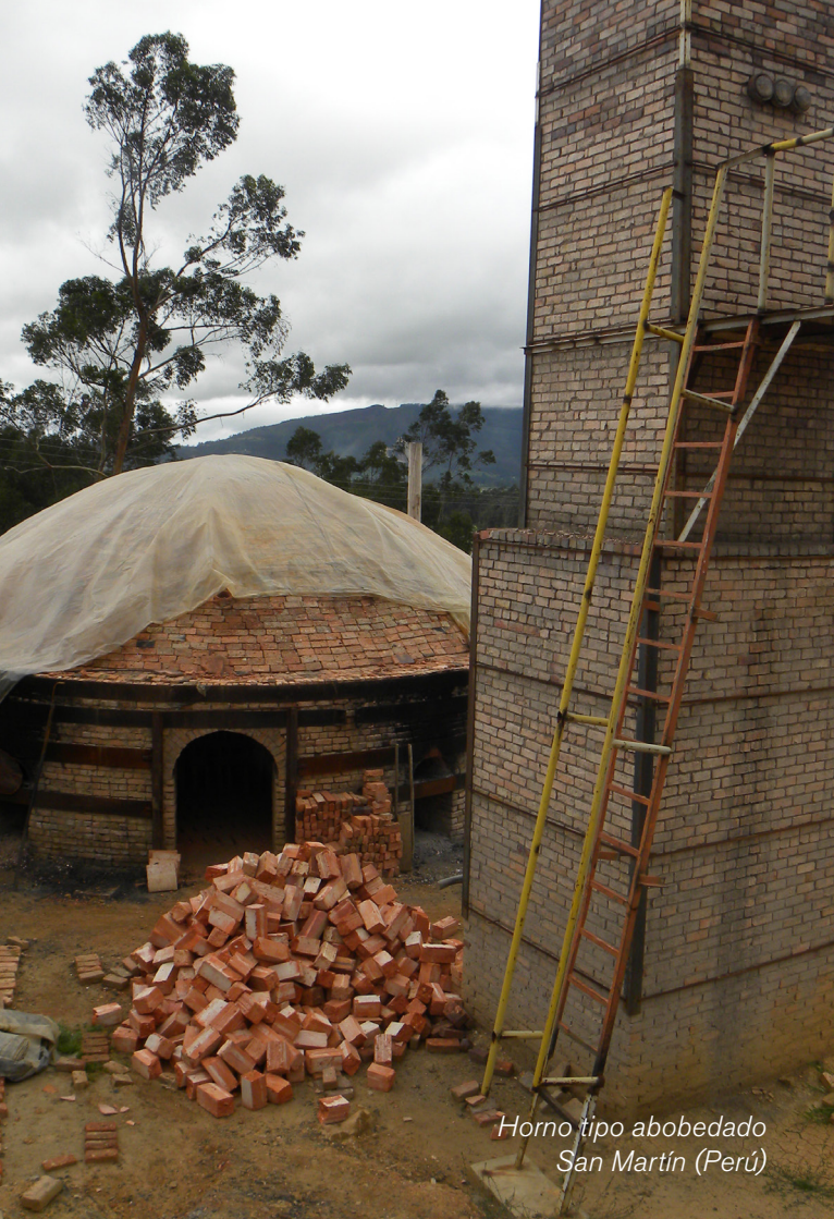
Horno tipo abovedado San Martín (Perú)