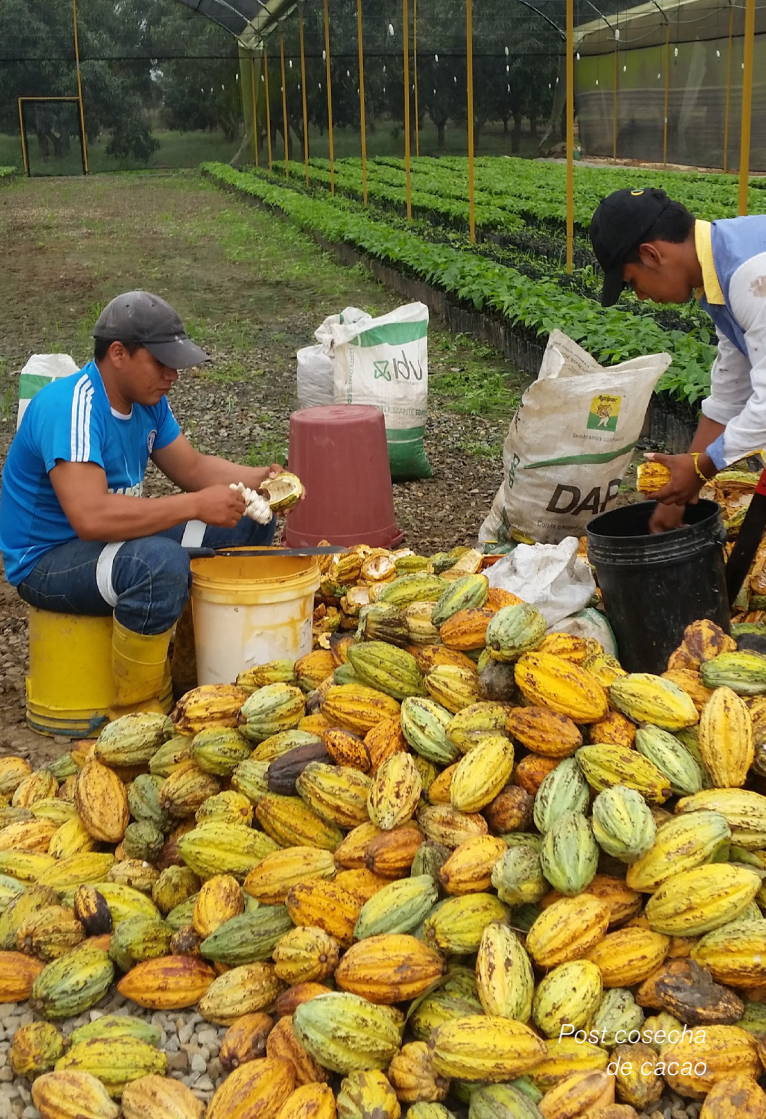
Post cosecha de cacao