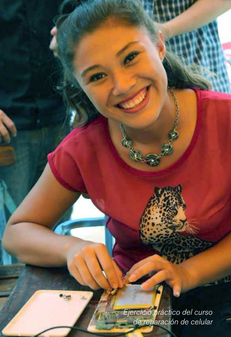
Ejercicio práctico del curso de reparación de celular