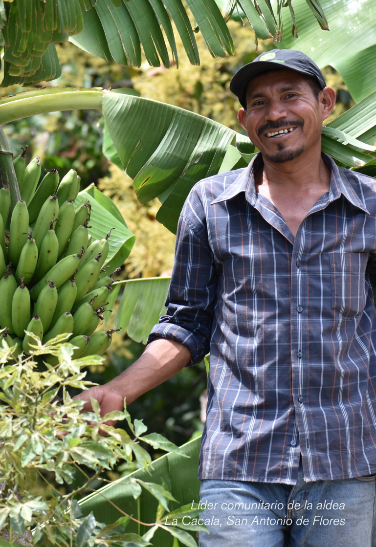
Líder comunitario de la aldea La Cacala, San Antonio de Flores