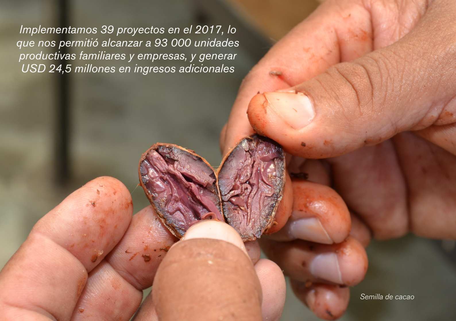
Semilla de cacao

Implementamos 39 proyectos en el 2017, lo que nos permitió alcanzar a 93 000 unidades productivas familiares y empresas, y generar USD 24,5 millones en ingresos adicionales