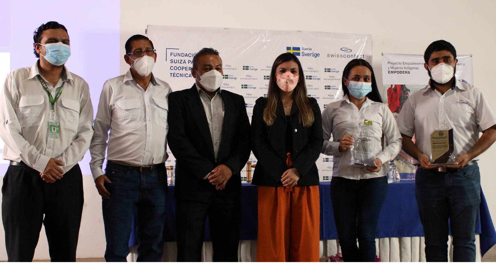
Entrega de reconocimiento a instituciones educativas, por la promoción de la orientación vocacional y laboral en el centro educativo.